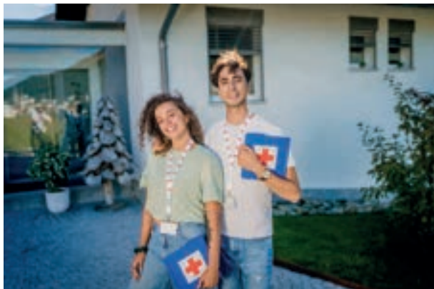
Studenten werben für das Rote Kreuz Baselland

Mit der Haustüraktion möchte das Rote Kreuz Baselland seine regionalen Hilfsangebote nachhaltig sichern. Es dankt allen herzlich, die mit ihrer Mitgliedschaft einen wichtigen Beitrag für Menschen in der Region leisten.