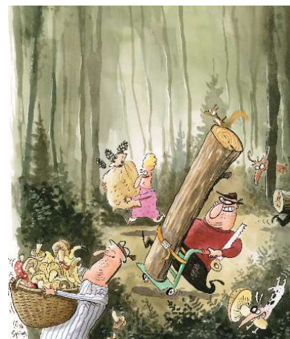
Wir sammeln und pflücken mit Mass