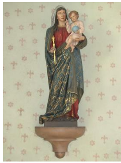
Jeweils Donnerstag um 19.00 Uhr 2. / 9. / 16. / 23. Mai Andachten im Mai mit Gesang, Gebet und Meditation

Dienstag, 2. April, 20.00 – 21.30 Uhr Pfarreirat