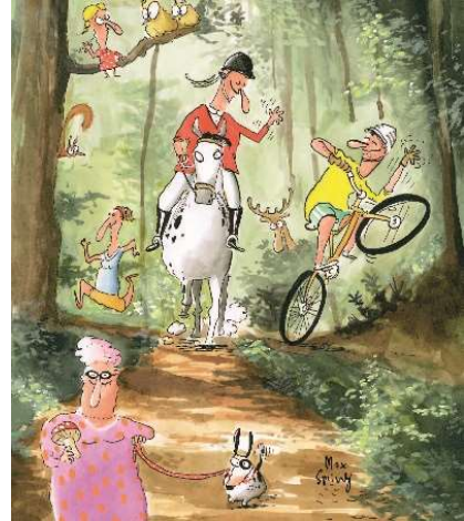
Wir respektieren einander

Den ganzen Wald-Knigge können Sie unter www.waldknigge.ch einsehen und in beliebiger Anzahl bestellen oder herunterladen. Er ist übrigens auch für die Schule geeignet. Mehr Infos zum Wald unter: www.waldschweiz.ch